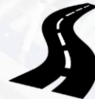
Дорожная инфраструктура (автомобильные дороги)