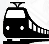
Железнодорожные пути необщего пользования