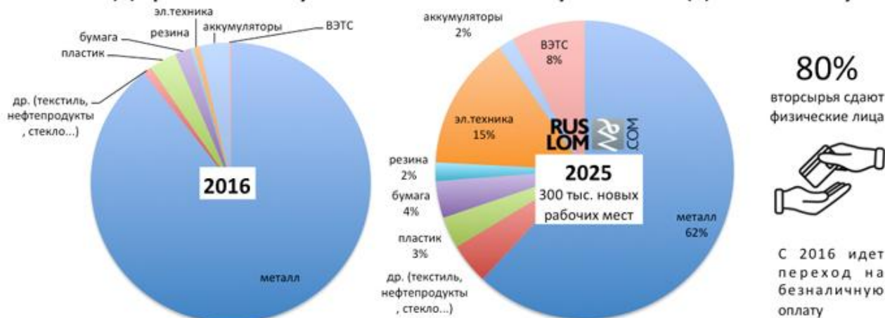
Таблица. Относительная доля вторичных материальных ресурсов в денежном выражении