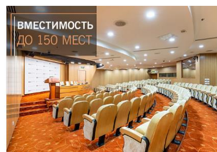
Пресс-зал для PR-мероприятий в центре Москвы