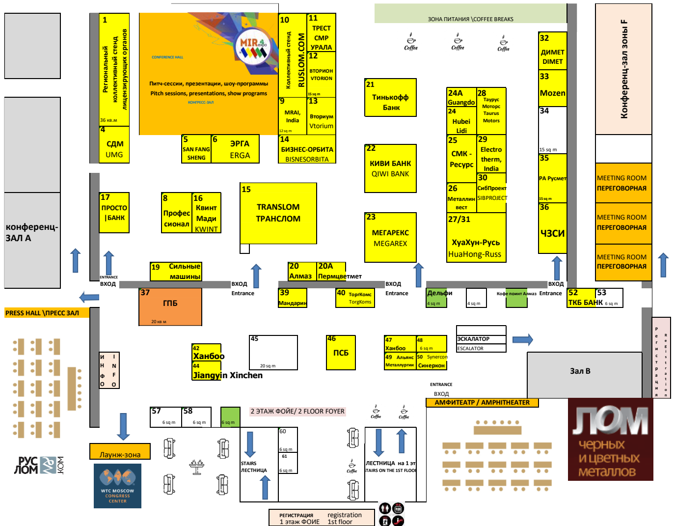
СХЕМА ВЫСТАВКИ 2024