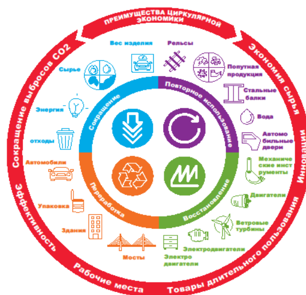
Сталь в циркулярной экономике: 4R

при использовании новых цифровых технологий, блокчейн и электронных сервисов.