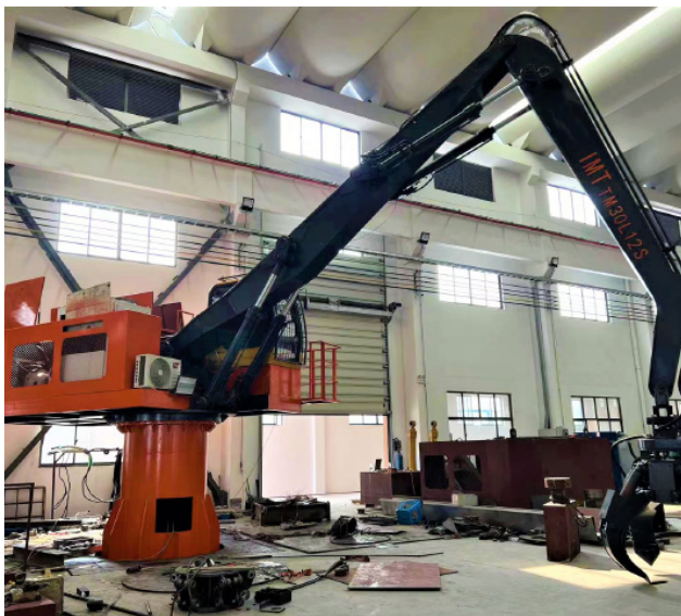
Фото тех.тур г. Альметьевск