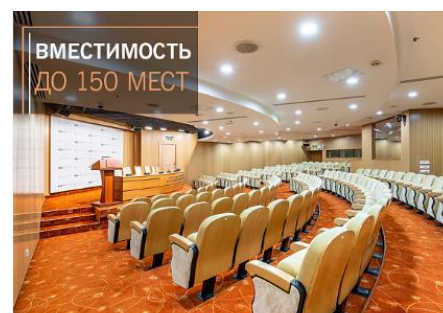
Пресс-зал для PR-мероприятий в центре Москвы