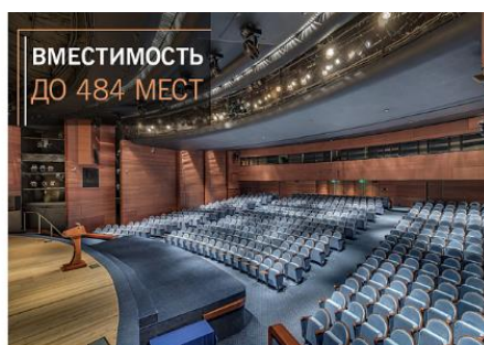
Конференц-зал «Амфитеатр» с максимальным комфортом