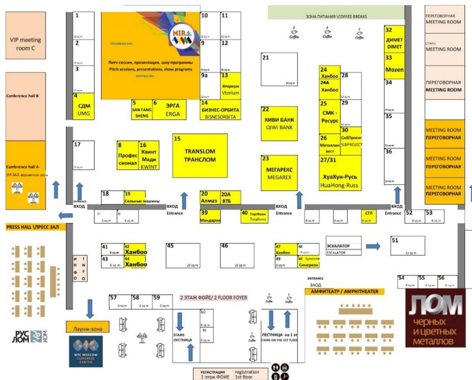
СХЕМА ВЫСТАВКИ 2024

Ведущий бизнес- и конференц-отель России, Plaza Garden Moscow - World Trade Centre, предлагает своим гостям первоклассный уровень комфорта, неповторимую элегантность и функциональность номеров, высший уровень безопасности и безупречный сервис